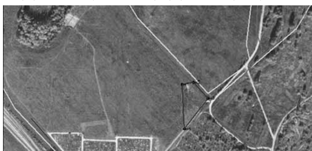
Масштаб 1 :4000

Адрес земельного участка: Российская Федерация, Московская область, Дмитровский городской округ, г. Дмитров, территория мест захоронения земельный участок №2.