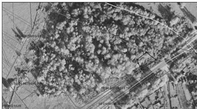
Масштаб 1 :2000

Адрес земельного участка: Российская Федерация, Московская область, Дмитровский городской округ, село Внуково, территория мест захоронения земельный участок 1.