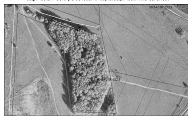
Масштаб 1 :2000

Адрес земельного участка: Российская Федерация, Московская область, Дмитровский городской округ, дер. Ярово, территория мест захоронения земельный участок 1.