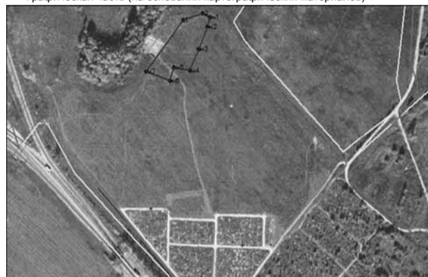
Масштаб 1 :4000

Адрес земельного участка: Российская Федерация, Московская область, Дмитровский городской округ, г. Дмитров, территория мест захоронения земельный участок № 2. Условные обозначения: - Граница земельного участка, сведения о котором содержатся в ЕГРН - вновь образованная часть границы, сведения о которой достаточны для определения ее местоположения