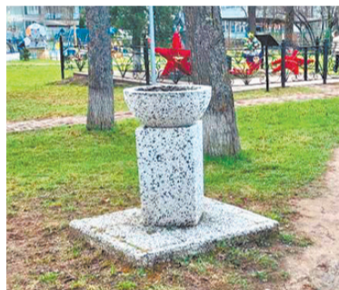
«Расстрельная яма» в селе Борисово.

Это место особенное для тех, кто здесь живет. Люди чтят память об односельчанах, расстрелянных немец-