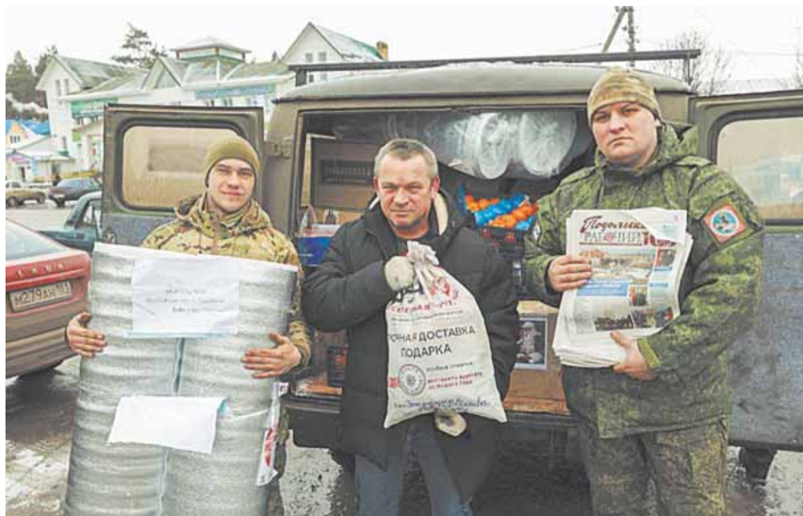
АНДРЕЙ ВОРОБЬЕВ, губернатор Московской области:

Еще один гуманитарный груз с техникой и вещами первой необходимости для бойцов на днях был отправлен из Подольска в зону проведения специальной военной операции. Он уже доставлен в пункт назначения