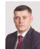
ГРИГОРИЙ АРТАМОНОВ, глава городского округа Подольск:

– Ремонт сетей и перекопанные улицы могут доставлять неудобства жителям. Поэтому мы стараемся увязать эти работы с благоустройством. Когда все работы под землей будут завершены – приведем в порядок газоны, парковки, тротуары, пешеходные дорожки, детские и спортивные площадки.