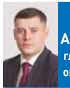
ГРИГОРИЙ АРТАМОНОВ, глава Городского округа Подольск:

– В Подмосковье идет масштабная модернизация систем водоснабжения и водоотведения. Это не только повышение качества жизни жителей, но и забота об экологии».