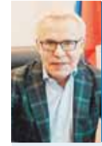
ВЯЧЕСЛАВ ФЕТИСОВ, депутат Государственной Думы, член Высшего совета партии «Единая Россия»:

– Согласно данным, заявки подали более 880 человек. И особенно показательно, что каждый пятый из них – моложе 35 лет. Российская молодежь осознанно идет в политику, готова брать на себя ответственность за будущее страны. А рядом с ней – настоящие люди труда: педагоги, врачи, герои СВО. Это убедительно доказывает: будущее формируют те, кто отвечает за него не на словах, а на деле.