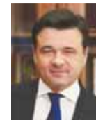
АНДРЕЙ ВОРОБЬЕВ, губернатор Московской области:

НАШ КОРР. ФОТО: ТГ-КАНАЛ ГЛАВЫ ГОРОДСКОГО ОКРУГА ПОДОЛЬСК @GRARTAMONOV