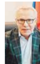
ВЯЧЕСЛАВ ФЕТИСОВ, депутат Государственной Думы, член Высшего совета партии «Единая Россия»: