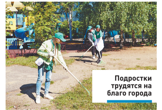
Подростки трудятся на благо города

Если раньше реализация «Лета добрых дел» осуществлялась только в летние каникулы, то сейчас программа существенно расширена: трудоустройство подростков осуществляется с 1 марта по 31 октября. Но основной наплыв желающих стать участниками программы – в летнее время.