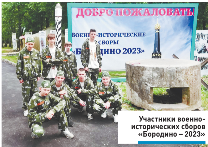
Участники военно-исторических сборов «Бородино – 2023»

Сборы проходят в две смены. На первую прибыли ребята из разных регионов