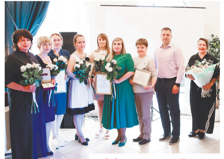
Работники социальной защиты Дмитровского городского округа