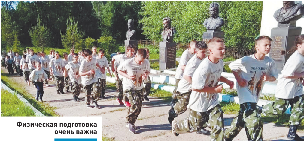
Физическая подготовка очень важна

Обладатели высших баллов по двум и более предметам получают единовременную выплату 100 тысяч рублей.