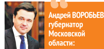
Андрей ВОРОБЬЕВ, губернатор Московской области:

К сегодняшнему дню территорию уже очистили от поросли и старых кустов,