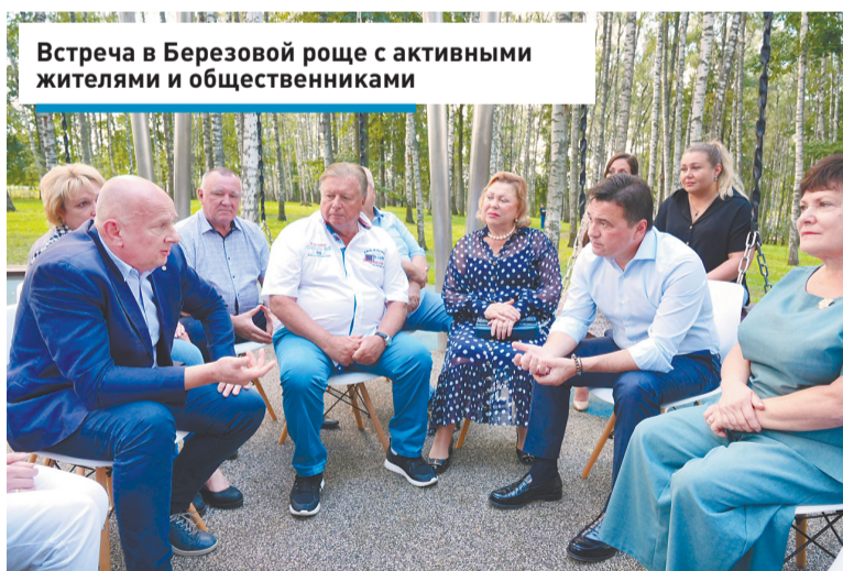
Встреча в Березовой роще с активными жителями и общественниками

и памп-трек, оборудовали элементы для трюков, перила. В этом году начали благоустраивать Советскую площадь, где сделают прогулочные и беговые дорожки, установят на постаменте памятник Юрию Долгорукому.