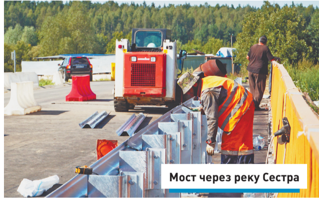
Мост через реку Сестра

На 50% уже выполнены работы на мосту через реку Яхрому. Сейчас производится демонтаж на левой стороне сооружения. Движение по правой полосе открыто. Кроме того, осуществляется плановое обновление моста через реку Сестру.