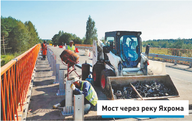
Мост через реку Яхрому