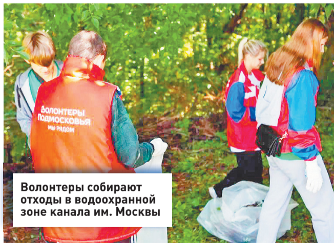
Волонтеры собирают отходы в водоохранной зоне канала им. Москвы

Участие в них уже стало доброй традицией. Их цель – очистить от мусора берега водоемов и тем самым популяризировать среди населения идею бережного отношения к природе.