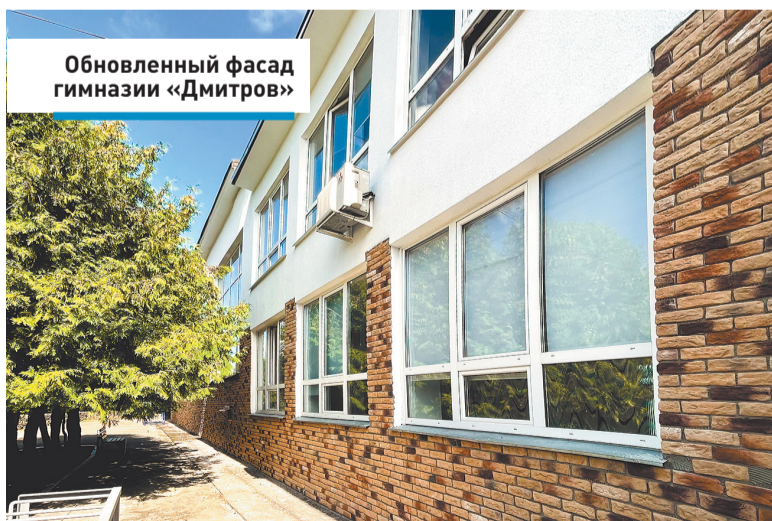
Обновленный фасад гимназии «Дмитров»

Школа с многолетней историей будет отремонтирована до конца этого года.