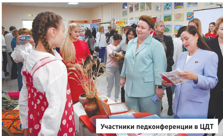
Участники педконференции в ЦДТ