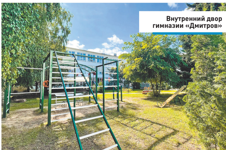
Внутренний двор гимназии «Дмитров»

Это учебное заведение расположено рядом с Казанской церковью на одной из старинных улиц города. Здание двухэтажное, 1968 года постройки. Последняя реконструкция фасада проводилась в 2005 году.