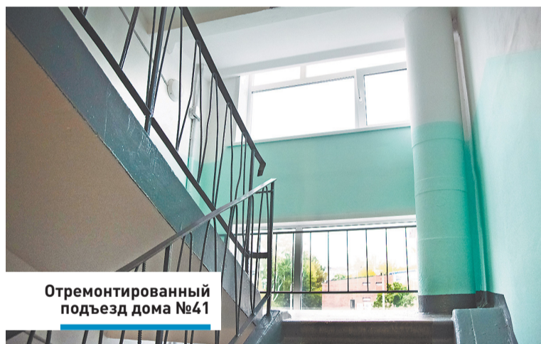
Отремонтированный подъезд дома №41

«Ремонт шикарный. Большое спасибо всем, кто его провел», – поблагодарила она.