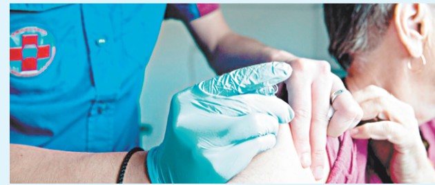
График работы: понедельник – пятница с 08.00 до 20.00.

Также вы можете пройти вакцинацию в поликлинике, амбулатории или в ФАП по месту прикрепления. Терапевт или педиатр проведут осмотр и направят на прививку.