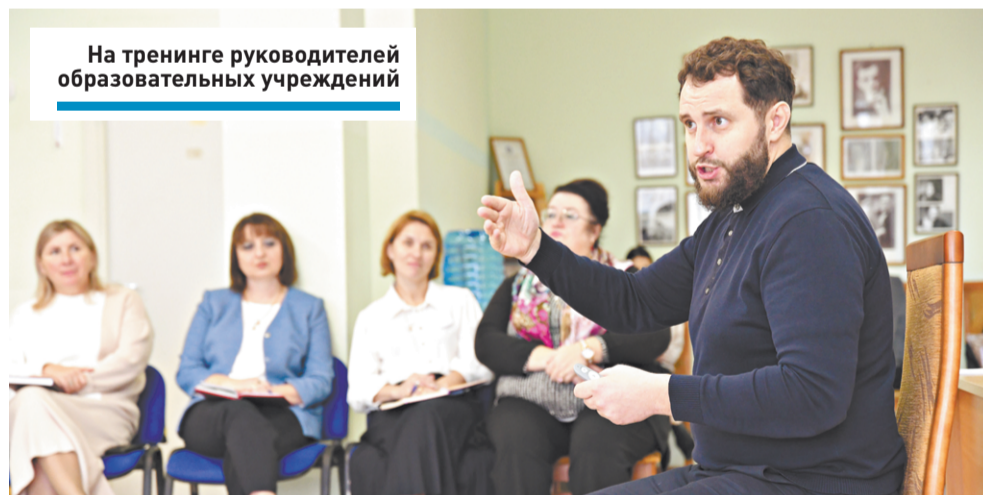
На тренинге руководителей образовательных учреждений

Директора школ тоже учатся. И считают: это делать никогда не поздно.