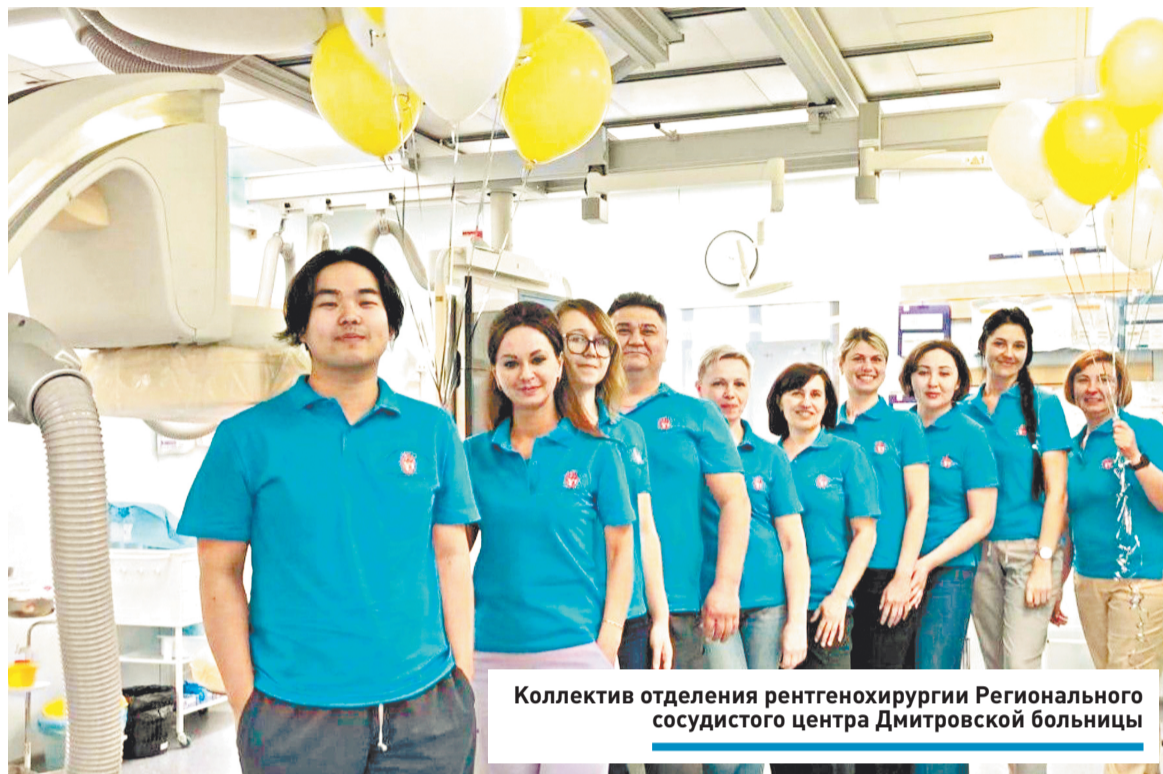
Коллектив отделения рентгенохирургии Регионального сосудистого центра Дмитровской больницы

Врачи Дмитровской больницы выполняют уникальные операции