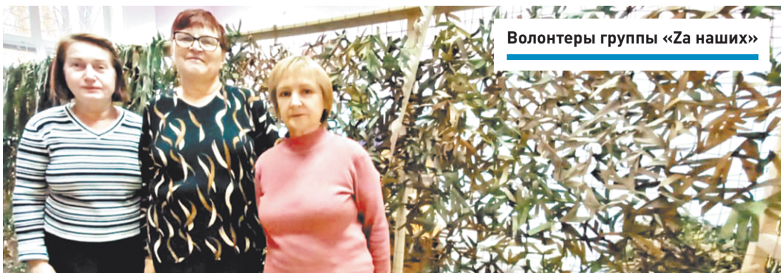
Волонтеры группы «За наших»