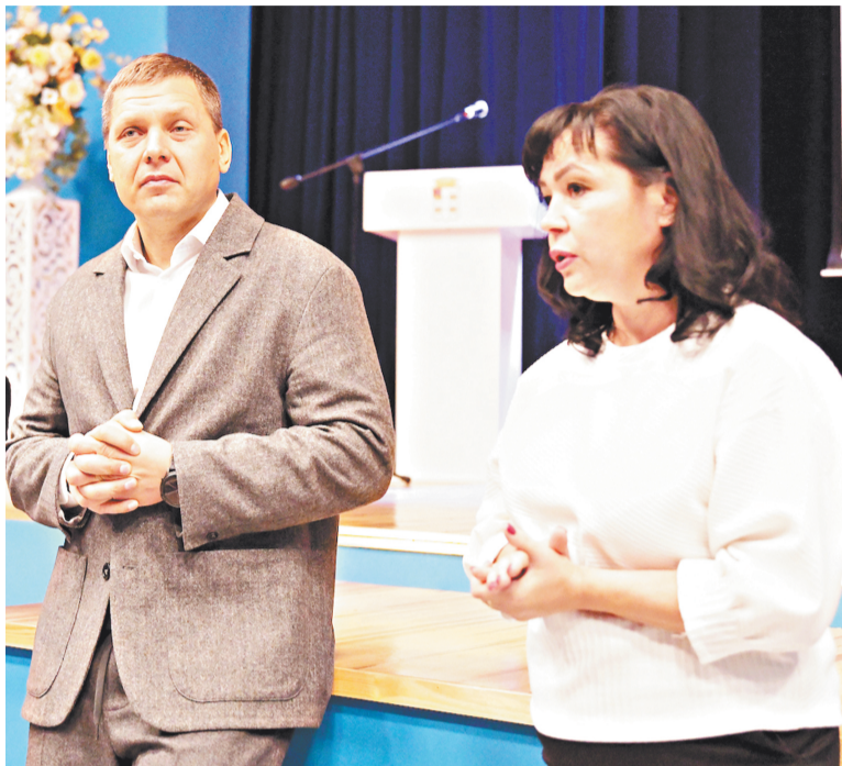
Глава Дмитровского городского округа Илья Поночевный на встрече с руководителями культурно-досуговых учреждений

презентации от культурно-досуговых центров, домов культуры и живое обсуждение темы «Что мы можем сделать еще интересного, оригинального, нужного жителям?».