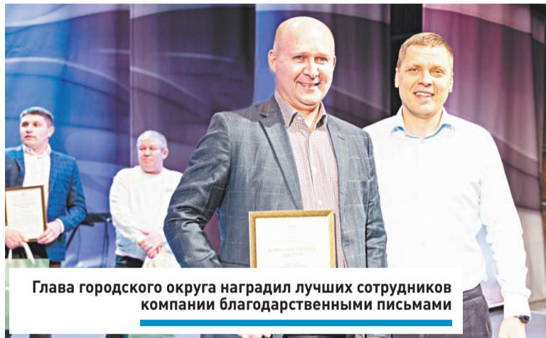
Глава городского округа награждает лучших сотрудников компании благодарственными письмами

Объем производства агрохолдинга «Дмитровские овощи» в 2023 году вырос на 25 процентов