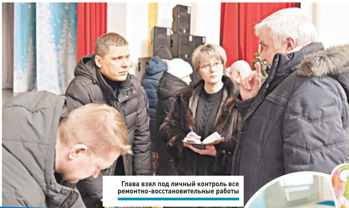
Глава взял под личный контроль все ремонтно-восстановительные работы

Для оперативного информирования жителей о том, как идут работы, и сбора заявок по отсут-