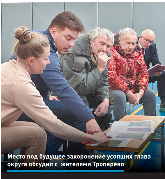
Место под будущее захоронение усопших глава округа обсудил с жителями Тропарево