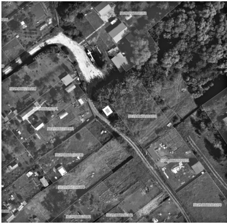
- некапитальный объект, подлежащий демонтажу

Схема расположения самовольно установленного некапитального объекта, подлежащего демонтажу по адресу: Московская область, городской округ Воскресенск, с. Новлянское, ул. Речная, вблизи земельного участка с кадастровым номером 50:29:0060210:2272