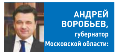
АНДРЕЙ ВОРОБЬЕВ, губернатор