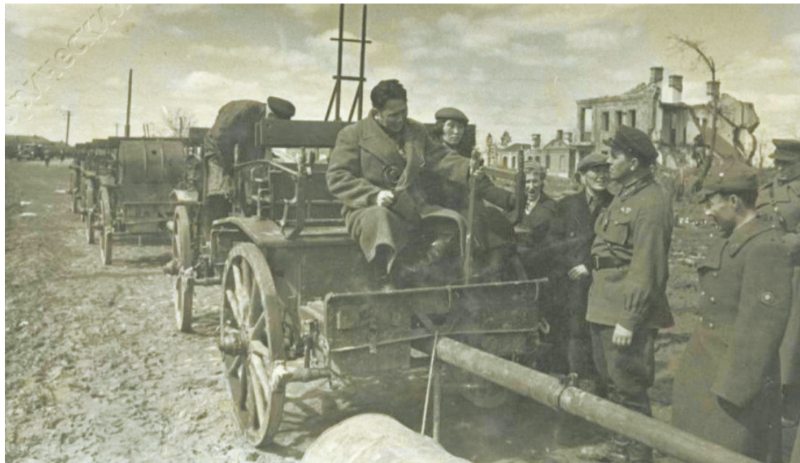
Осмотр трофеев в Можайске

Делегация из Тувы прибыла в Москву 21 апреля 1942 года, с подарками для Красной армии. Гости привезли бойцам Западного фронта 50 вагонов вещей и продуктов. После приема командующим Западным фронтом Г.К. Жуковым, тувинская делегация выехала на фронт для вручения подарков бойцам Красной армии. Тувинцы посетили места недавних боев за Москву, в том числе и Можайск. Именно тогда, в ходе того памятного для старейших жителей нашего города визита делегации братского тувинского народа, можайцы сделали и вручили гостям альбом с фотография-