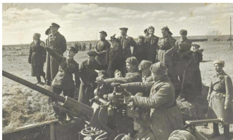
Тувинская делегация в Можайске