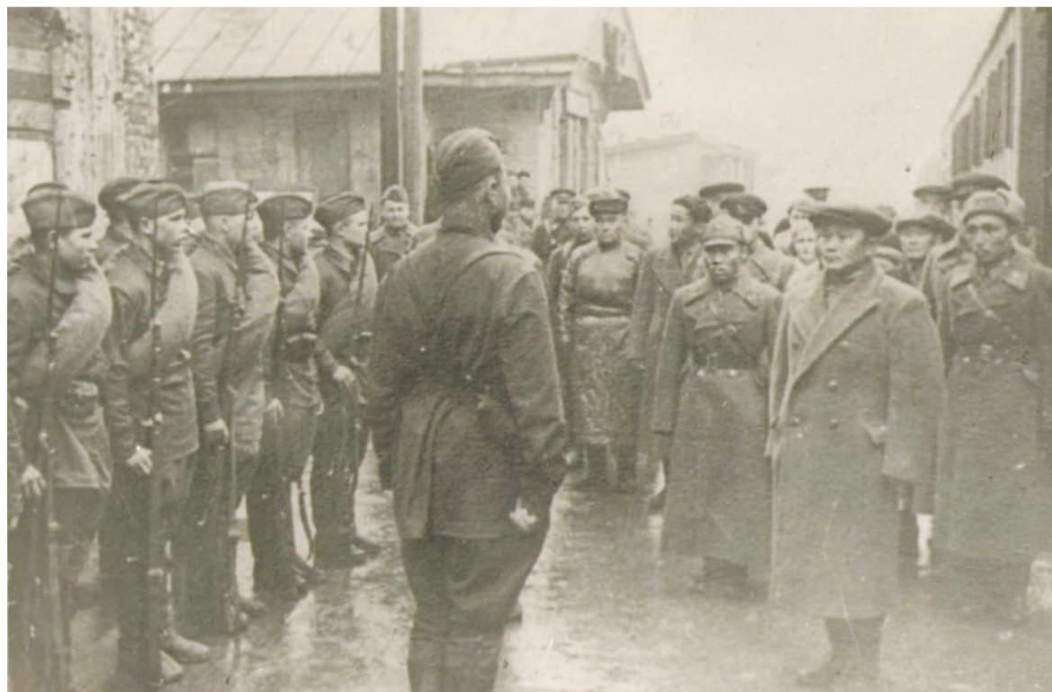
В честь 24-й годовщины со дня основания Красной армии трудящиеся Тувинской Народной Республики направили на Западный фронт первый эшелон подарков, состоявший из 50 вагонов. Он оценивался в 872856 акша. На снимке: встреча делегации в Можайске. 1942 г.

ми освобожденного 20 января 1942 года Можайска.