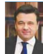
АНДРЕЙ ВОРОБЬЕВ, губернатор Московской области:

ПРОГРАММА «СОЦИАЛЬНАЯ ИПОТЕКА» РЕАЛИЗУЕТСЯ В МОСКОВСКОЙ ОБЛАСТИ С 2016 ГОДА ПО ИНИЦИАТИВЕ ГУБЕРНАТОРА МОСКОВСКОЙ ОБЛАСТИ. СОБСТВЕННЫМИ КВАДРАТНЫМИ МЕТРАМИ МОГУТ ОБЗАВЕСТИСЬ МЕДИКИ, УЧИТЕЛЯ, МОЛОДЫЕ УЧЕНЫЕ, МОЛОДЫЕ СПЕЦИАЛИСТЫ В ОБЛАСТИ ОПК И СПОРТИВНЫЕ ТРЕНЕРЫ.