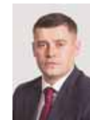
ГРИГОРИЙ АРТАМОНОВ, глава городского округа Подольск:

«Зима – это не только обильные осадки, но и короткий световой день. Обсудили качество мониторинга вверенных ПКБ территорий. Отдельно остановились на состоянии осветительных элементов. Необходимо оперативно проводить необходимый ремонт,