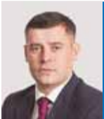
ГРИГОРИЙ АРТАМОНОВ, глава городского округа Подольск:

Уже завтра город будет отмечать 243-ю годовщину со дня основания Подольска и Подольского уезда. В этот день на самых разных площадках будут проходить торжественные патриотические, познавательные и развлекательные мероприятия. Для подольчан и гостей округа подготовлена обширная культурная программа