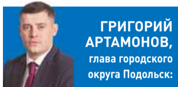
ГРИГОРИЙ АРТАМОНОВ, глава городского округа Подольск:

коллективный дух. Всего в округе на лед выходят почти две тысячи человек ежегодно. Целую плеяду ярких чемпионов, которые неоднократно становились победителями и призерами соревнований международного уровня, вы-