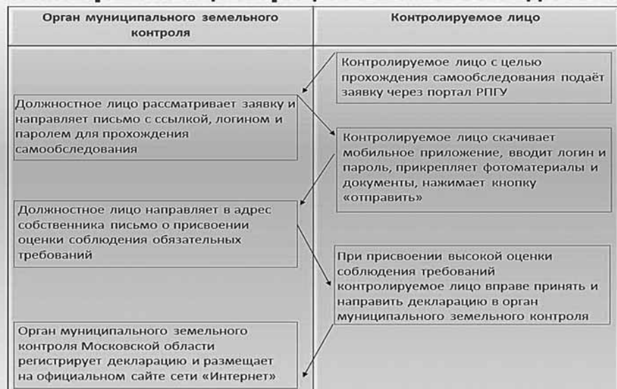
Схема организации процесса самообследования