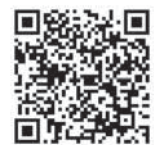
ГРАФИК ПРИЕМА НАСЕЛЕНИЯ ГЛАВЫ И ЗАМЕСТИТЕЛЕЙ МОЖНО НАЙТИ НА САЙТЕ

как за ними необходимо следить, убирать. Сейчас это не делается.